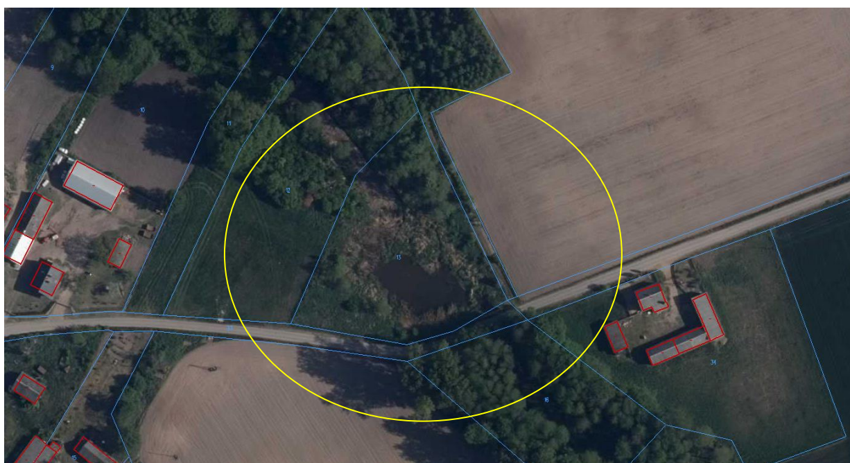
Rys. nr 2. Lokalizacja przedsięwzięcia – dane katastralne

Teren inwestycji ma kształt nieregularny kształt. Zachodnia granica działki ma długość około 89 metrów, południowa granica około 98 metrów. Od strony południowej działka jest ograniczona poprzez drogę gminną. Z pozostałych stron tj. od północy, wschodu i zachodu teren graniczy z działkami prywatnymi.